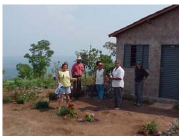
PA/Mato Grosso (habitação)