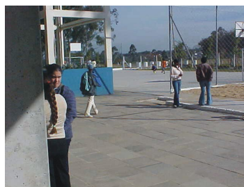
Figura 2: Quadras desportivas