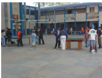
Figura 1: Pátio central com mesas de jogos

Foram identificadas algumas boas práticas que podem contribuir para o melhor desempenho das atividades do Projeto Agente Jovem: uso de indicadores de desempenho em Salvador/BA; promoção de eventos relacionados ao Projeto em São Paulo/SP e no estado do Rio Grande do Sul; trabalho de preparação gradual de orientadores sociais sem o perfil recomendado em Santo Amaro/BA; os municípios de Viamão/RS (figuras 1 e 2) e Manaus/AM estabeleceram parcerias com escolas municipais para desenvolvimento das atividades do Projeto.