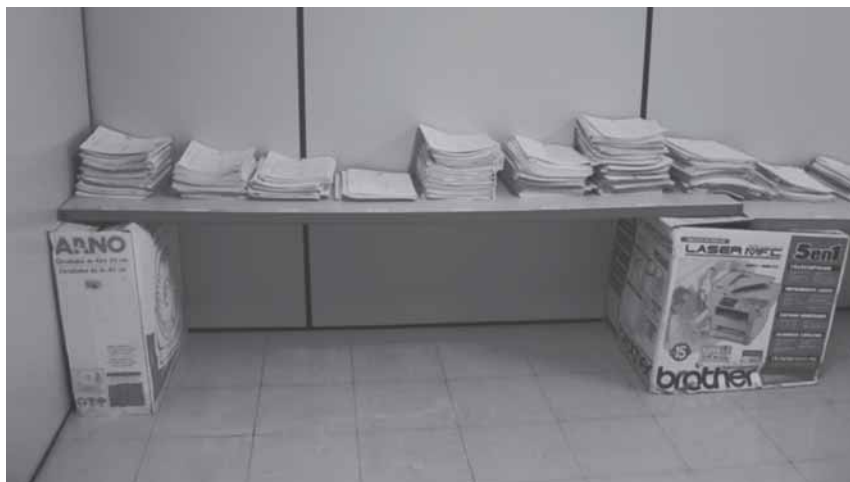
Figura 1 – Insuficiência de arquivos