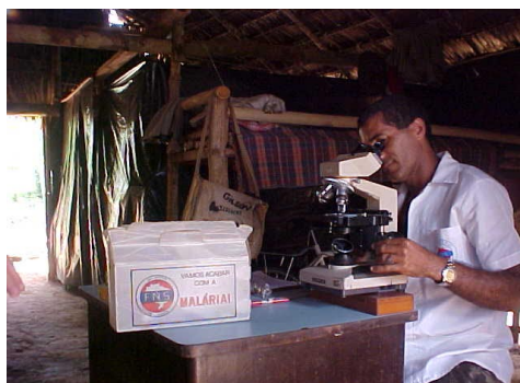
Figura 2 – Microscopista trabalhando no município de Plácido de Castro/AC

O treinamento de pessoas oriundas da própria comunidade, em caráter de trabalho voluntário, para atuarem como microscopistas, poderia contribuir para essa melhoria, vez que agilizaria o diagnóstico e o tratamento da doença.