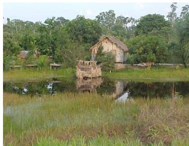
Figura 3 – Casa à beira da água no Estado do Acre.