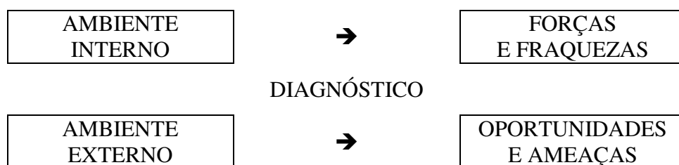
Figura 1 – Elementos integrantes do diagnóstico