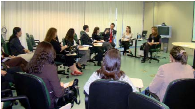
Encontro reuniu representantes de vários órgãos

Após a apresentação, os participantes compartilharam as experiências de cada órgão na gestão da movimentação interna, e discutiram os desafios da área de gestão de pessoas na busca da alocação ideal para atender as necessidades dos servidores e da organização.