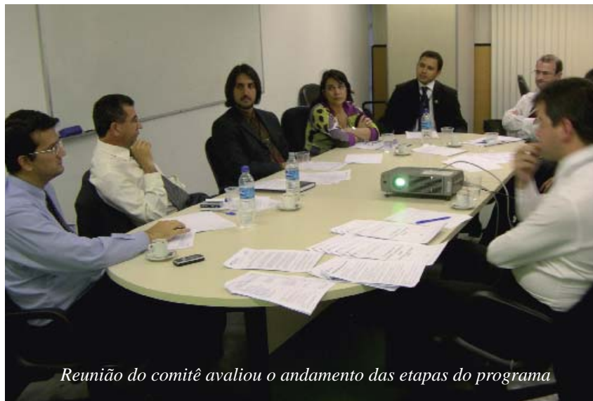
Reunião do comitê avaliou o andamento das etapas do programa