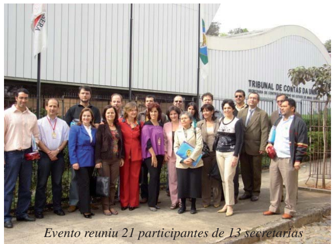
Evento reuniu 21 participantes de 13 secretarias

muito positivo, por permitir a participação dos executores na escolha das questões de auditoria e nos enfoques a serem dados nos diversos temas que serão abordados na fiscalização.