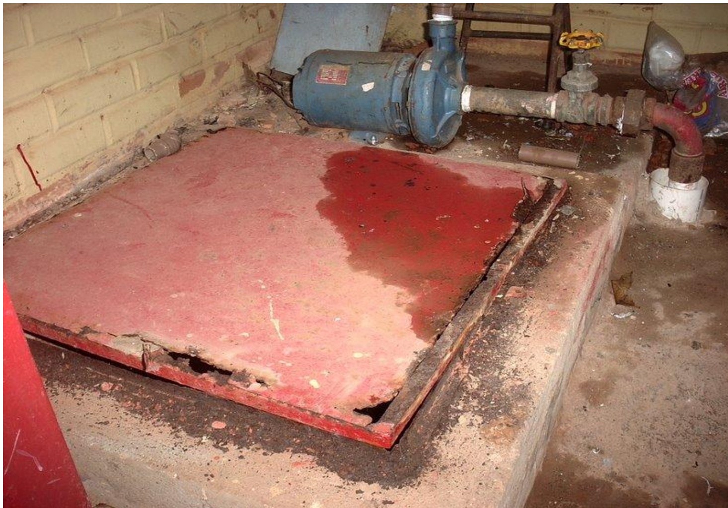
Instalações hidráulicas de escola em interior do Brasil